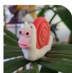
Des activités créatives, des jeux hors écrans tous les mois