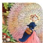
Des expositions et thématiques mensuelles