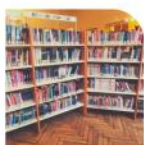
Un coin enfant coloré, un espace BD enfants, des mangas, des romans premières lectures