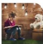
Des rendez-vous lecture